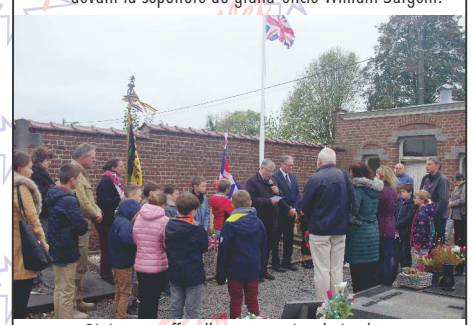
Cérémonie officielle au cimetière de Lesdain

Dans les pays du Commonwealth (Royaume-Uni, Canada, Australie, Nouvelle-Zélande,...), le coquelicot est associé à la mémoire de ceux qui sont morts à la guerre. Ceci est dû au fait qu'après les combats, les terres, mises à nus par les tirs d'obus et les tranchées, se couvrent de ces fleurs rouge sang. La graine du coquelicot, qui peut rester des années dans le sol vu qu'elle résiste bien au manque d'eau et à l'enfouissement, n'a besoin que d'une terre remuée et calcaire pour se mettre à pousser. Ce