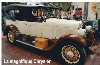
La magnifique Chrysler