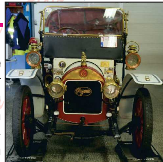
Ci-dessus, la fameuse Grégoire derrière le volant de laquelle Johnny prend la pose. ↓

FL. : Tu declares avoir atteint un nouveau but : celui d'entretenir et d'arriver à conduire ce type de véhicule, jusqu'à réapprendre à tourner la manivelle pour la mettre en route en l'absence évidente de batterie. Comment est né ce nouveau coup